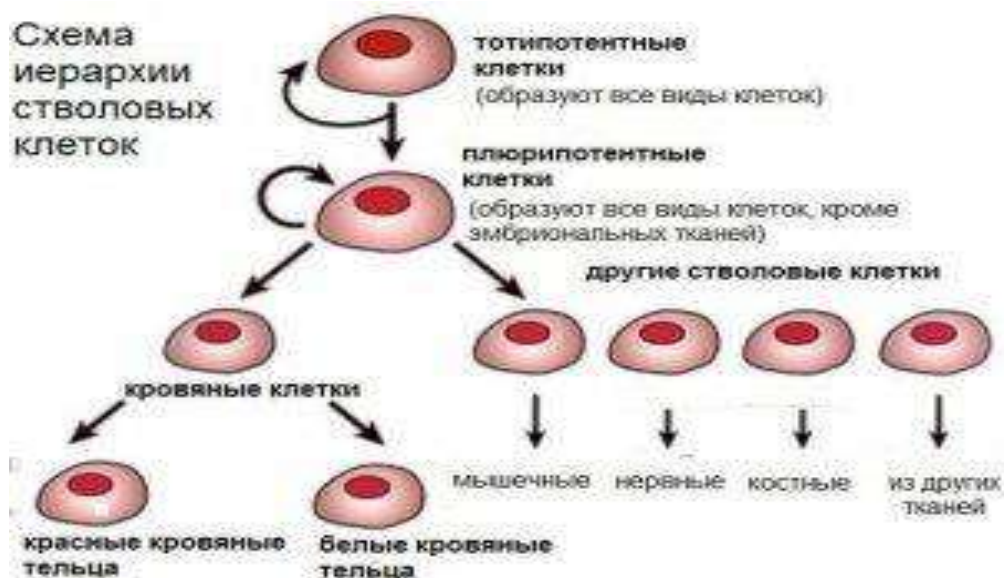
Рис. 6. Тотипотентность стволовых клеток

Эти уникальные свойства стволовых клеток костного мозга и дают возможность все с большим успехом внедрять и применять метод регенерации для восстановления различных органов или их функций. Свойство стволовых клеток превращаться (специализироваться) в любую клетку организма называют тотипотентностью