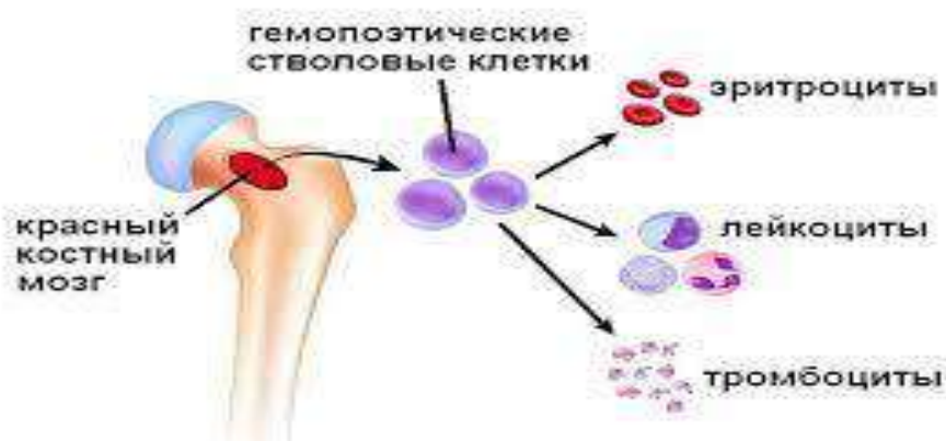
Рис.5. Функция красного костного мозга

тромбоцитам, лейкоцитам, различным тканям и органам– мышцам, нервам, печени поджелудочной железе и так далее[4].