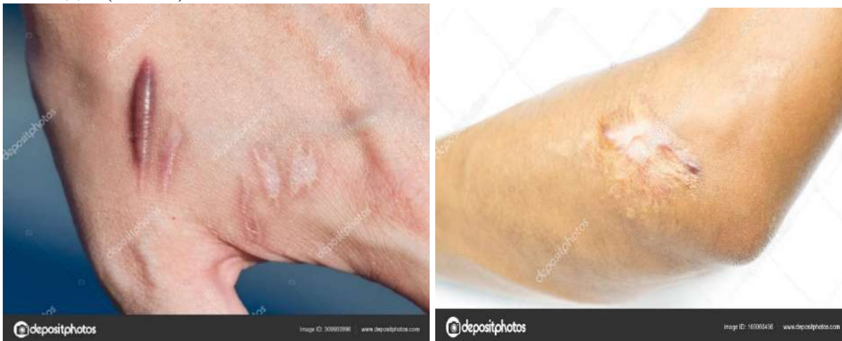
Рис. 3. Регенерационная гипертрофия: келоиды и рубцы на коже

Гиперрегенерация или регенерационная гипертрофия – это увеличение органа или ткани взамен погибшей с изменением его формы. Таковыми являются метаплазии – замещение клеток одного типа клетками другого типа – бельмо на роговой оболочке глаза, лейкоплакии языка, которые сопровождаются утолщением и ороговением слизистой щек, языка и уголков рта, слизистых оболочек, послеоперационные и травматические гипертрофические рубцы и келоиды (Рис. 3).