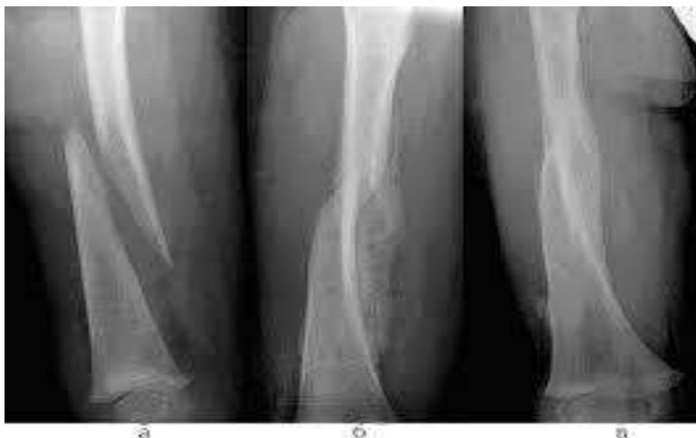
Рис.1. Репаративная (восстановительная) регенерация костной ткани после перелома.

На фоне современных позвоночных животных своей уникальной способностью к регенерации выделяются Саламандры. Они быстро отрастают новые ноги, хвосты и даже внутренние органы. Ученые не исключают что такие возможности таятся и у людей, может им удастся раскрыть секрет регенерации у этих животных [2].