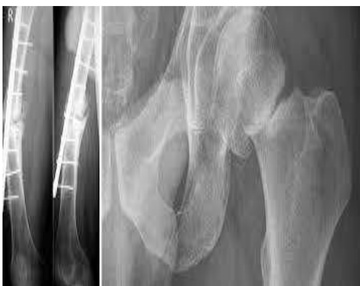
Рис. 2. Гипорегенерация. Формирование ложного сустава

Гипорегенерация: незаживающие трофические язвы голени, несрастание и расхождение послеоперационных швов, несросшиеся переломы и образование ложных суставов (Рис. 2).